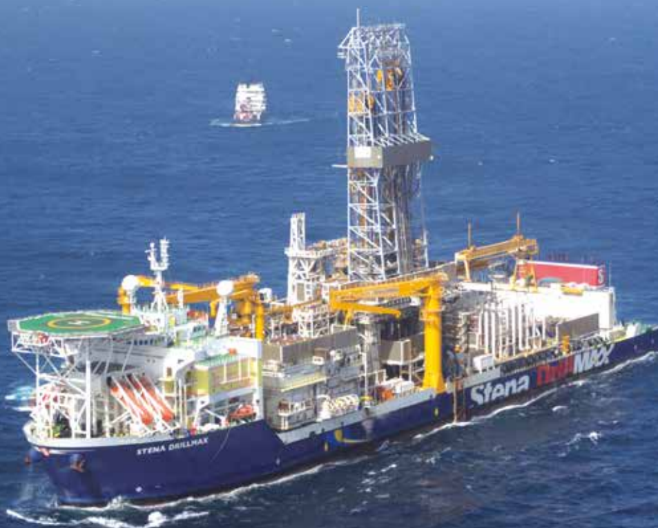
Het boorschip Stena Drillmax dat de exploratieput in offshore-blok 53 zal boren.