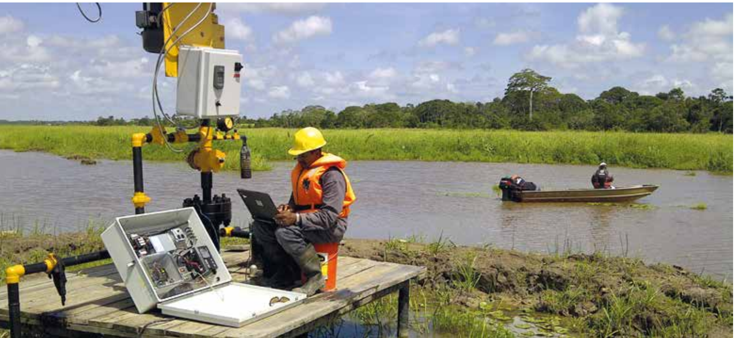
Een medewerker verzamelt data van een bron in de zwamp.

Het Tapa-Jai hydroproject is aangehouden vanwege zorgpunten over de mogelijke effecten op het leefklimaat in de omliggende streken en gemeenschappen. Het Ethanolproject wordt getemporeerd in afwachting van het arrangeren van de financiering en de formalisering van de samenwerking met een partner.