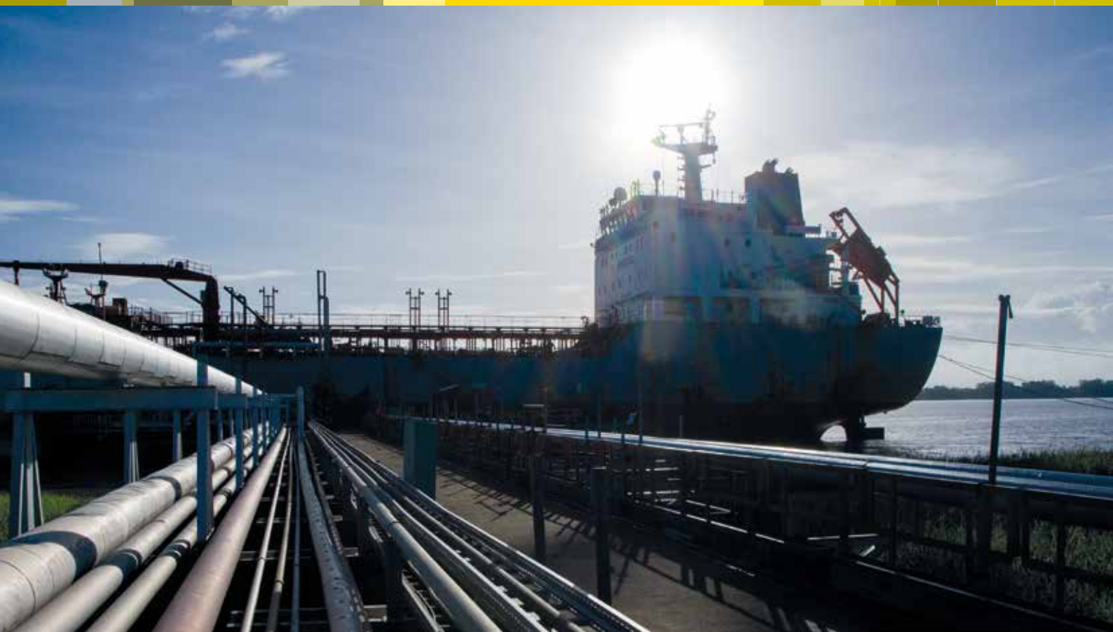
De haven bij de raffinaderij te Tout Lui Faut.