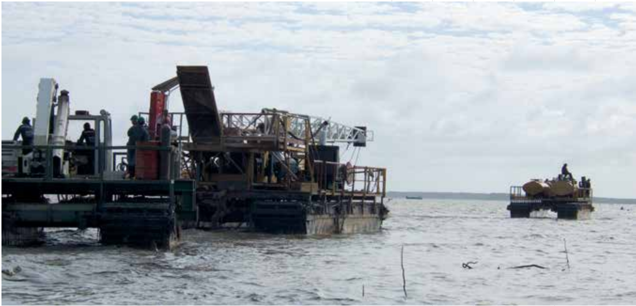
Exploratie-activiteiten voor de kust.

In Nickerie zal er een blok worden aangeboden aan internationale oliebedrijven voor verdere exploratie middels Production Sharing Contracts.