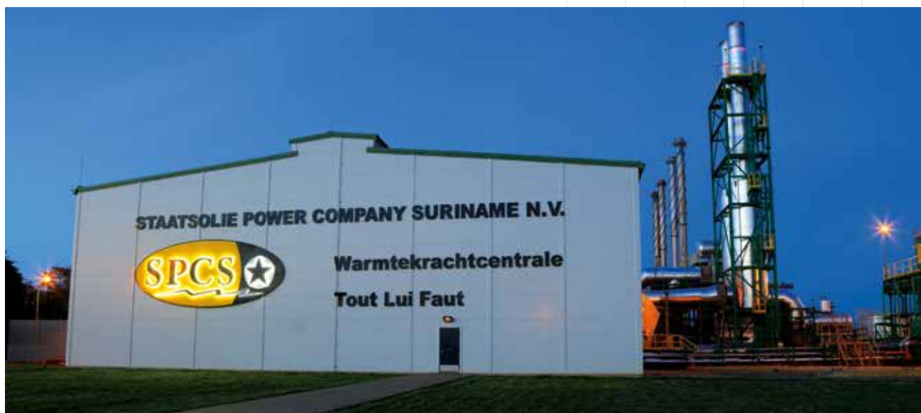
De elektriciteitscentrale van SPCS.

Aan de uitgifte van obligaties zijn geen kosten verbonden. Wel kunnen aan de belegger kosten in rekening worden gebracht voor de bewaring van de obligaties. De tarieven voor bewaring worden vastgesteld door de instelling waar de belegger zijn effectenrekening aanhoudt.