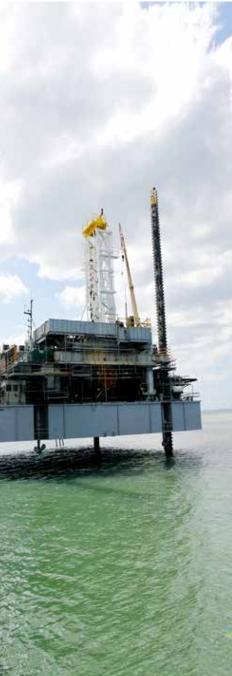
Boorplatform waarmee minimaal negen exploratieputten in het nearshore-blok 4 worden geboord in 2015.

De upstream cash-kosten 1 per barrel over de afgelopen 5 jaren variëren van USD 17 tot USD 24, waardoor Staatsolie in staat is tijdens perioden van relatief lage olieprijzen winstgevend olie te produceren. Ultimo december 2014 bedroeg de geconsolideerde netto-omzet USD 1041 miljoen en het eigen vermogen USD 1108 miljoen. De kasmiddelen bedroegen USD 117 miljoen en het balanstotaal USD 1931 miljoen.